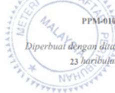
(MASYATI BINTI LABANG IBRAHIM)

Diperbuat dengan diandatangani oleh saya pada 23 haribulan Disember 2019